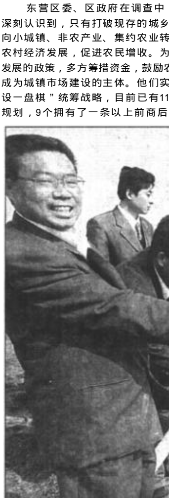
东营区委、区政府在调查中深刻认识到，只有打破现有的城乡二元结构，引导农民向小城镇、非农产业、集约农业转移，才能更好地拉动农村经济发展，促进农民增收。为此，该区制定了积极发展的政策，多方筹措资金，鼓励农民“造城”，让农民成为城镇市场建设的主体。他们实施“规划一支笔，建设一盘棋”统筹战略，目前已有11个小城镇完成了总体规划，9个拥有了一条以上前商后厂、上舍下商的现代

本报讯 近日，东营区牛庄镇、六户镇农民纷纷增大资金投入，在政府驻地的繁华街道上，新添了从事建材、生产资料批发等经营项目。这是东营区农民依靠小城镇建设、发展非农产业来拓宽增收渠道取得显著成效。目前已有30%的农民挺进了小城镇。